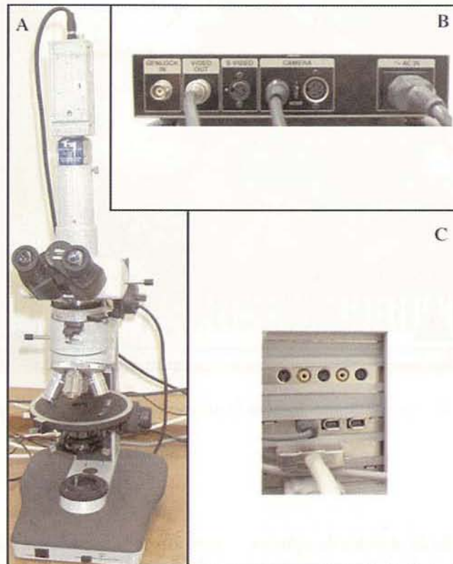
Fig. 1 - Sistema de videomicroscopia utilizado no projecto. A - Microscópio Nikon e sistema de video Sony. B - Apoio ao sistema de video com saída S-Video para transferência de imagens para o computador. C - Entradas/saídas da placa Miro DC-30 em computador Macintosh (G3-400).

Estas três tarefas foram automatizadas utilizando a possibilidade de programação de rotinas que o software Adobe® Photoshop® permite (designadas por “actions” pelo fabricante Adobe®). O tempo necessário para terminar o tratamento de 36 imagens é de cerca de 3.5 minutos (foi utilizado um computador Macintosh® 9600 com processador G3 a 400 Mhz e 96Mb de RAM. Para outras configurações a velocidade pode ser diferente). As imagens tratadas devem permanecer em duas pastas separadas, como atrás se referiu.